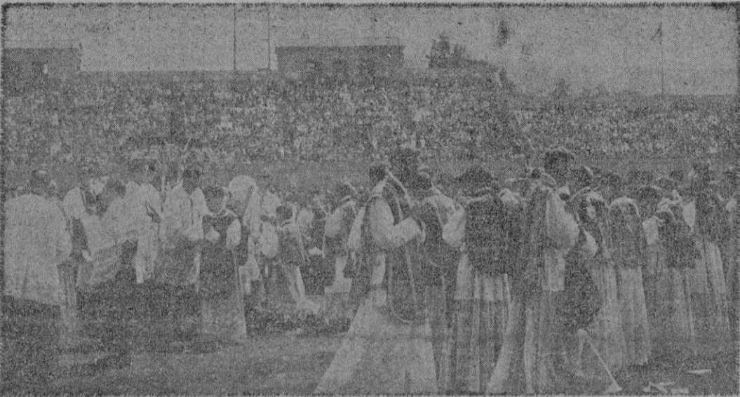
Barcelona. — Un aspecto del Estadio de Montjuich durante uno de los más emocionantes actos del Congreso Eucarístico: la ordenación simultánea de 819 sacerdotes, en su mayoría españoles.

ORDENACION SIMULTANEA DE 819 SACERDOTES EN EL ESTADIO DE MONTJUICH