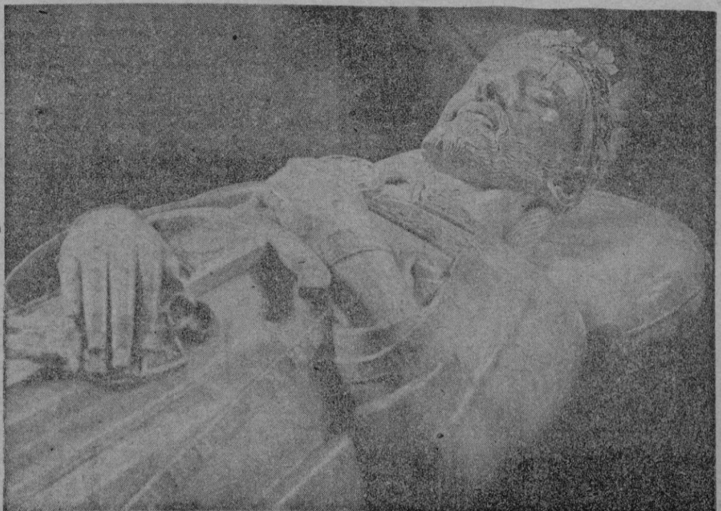
Estatua yacente del Rey Jaime I