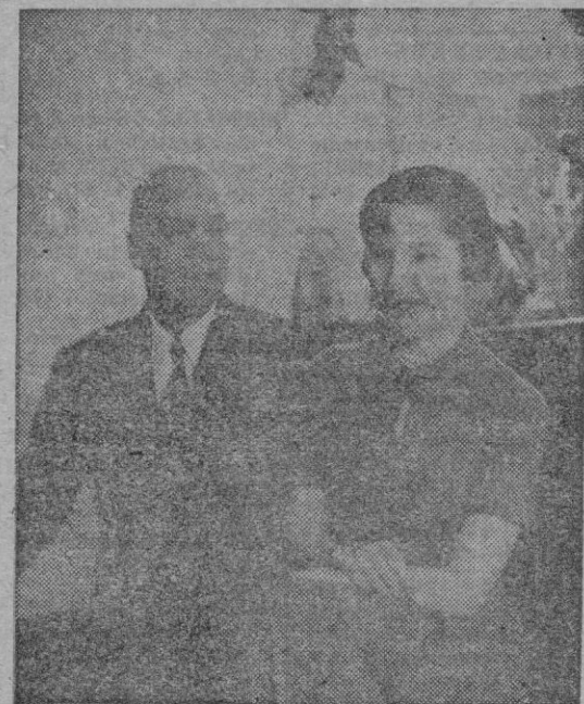
Mr. Bullit y su hija

He aquí como se expresaba en 1935, en documento confidencial, el Embajador de los Estados Unidos cerca del Gobierno de Moscú, Mister Bullit, al Departamento de Estado de su nación.