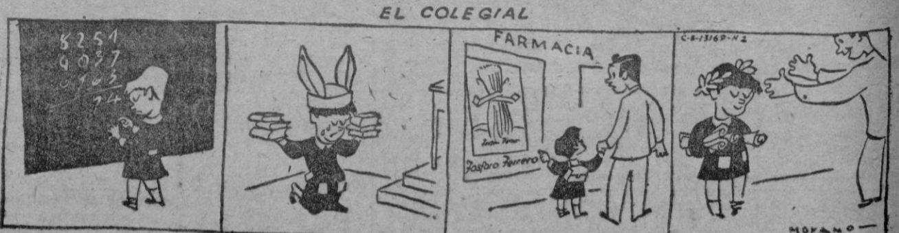
TOMAR "FOSFORO FERRERO" Y SERA SIEMPRE EL PRIMERO