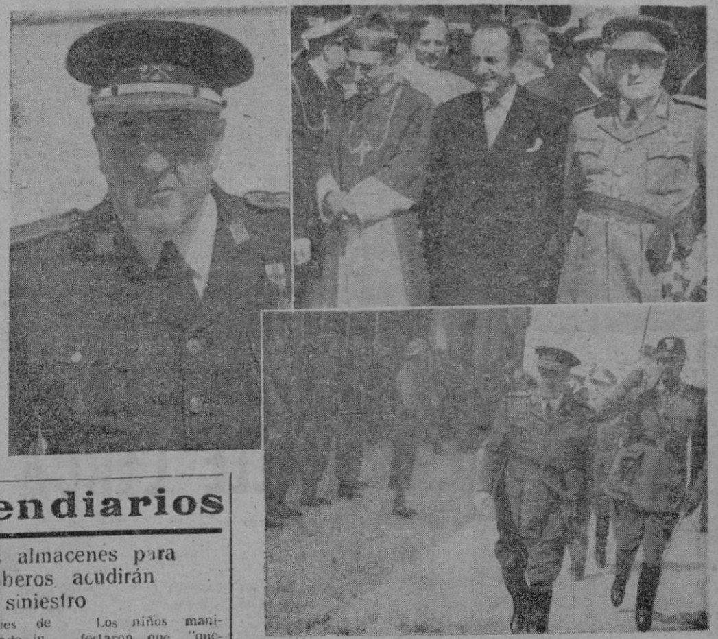
El nuevo Capitán General de Baleares, que llegó ayer a Palma. — El Obispo de Mallorca y el Gobernador Civil y Jefe Provincial, que acudieron a darle la bienvenida con otras autoridades. — El ilustre militar pasa revista a las fuerzas que le rindieron honores. — (Fotos "Juanet") (Información en páginas interiores)

Hoy, la última fotografía de nuestro Concurso "Baleares" busca una "estrella"