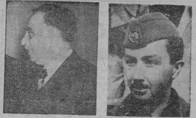
El Primer Ministro y el Regente iraqués

Washington, 8.—La Comisión de Asuntos Exteriores de la Cámara de Representantes ha dado su aprobación definitiva a la propuesta de Lye de ayuda al extranjero, por un total de 9.901.108 dólares, con la disposición especial de que España deberá recibir no menos de veinticinco millones de dólares en ayuda militar, económica y técnica. La Comisión ha incluido asimismo una cláusula por la que se amplía un nuevo préstamo a por la que Estados Unidos pueden ofrecer a España los cien millones de dólares que hasta ahora no se ha gastado.—Efe.