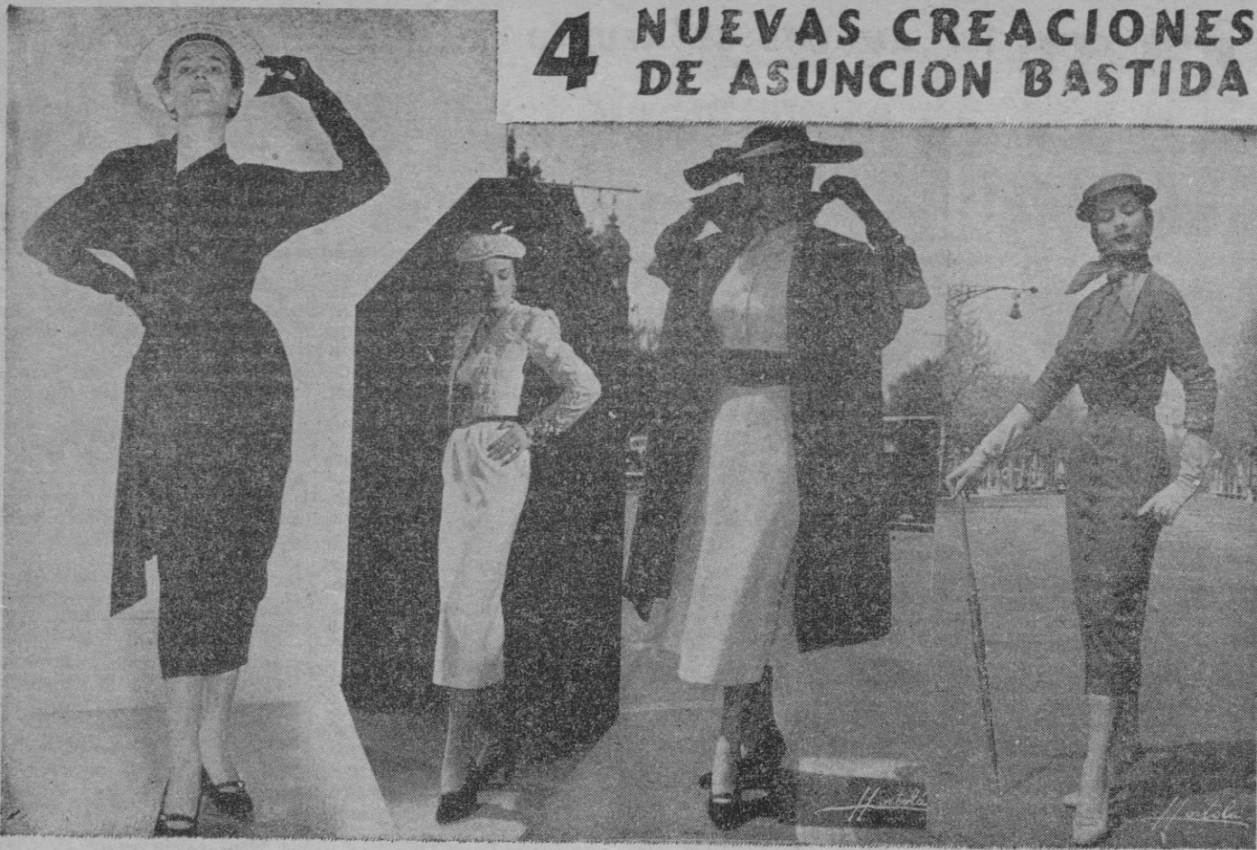
De izquierda a derecha: Vestido tricot de lana negra. "Tendencia española", modelo "Sevilla"; abrigo glacé con vestido de encaje "chantilly", vestido tricot mezcla gris con cuello y sombrero glacé listado en amarillo y negro