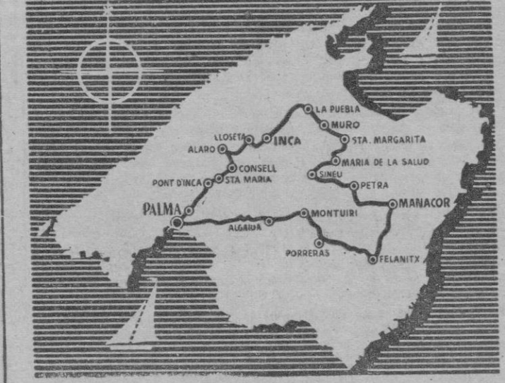
Suscribíos a la revista "Baleares".

los ases mallorquines diseminados por la isla y en todos se ha tenido particularísima atención. La vuelta Firestone pasará por todas partes. La caravana ciclista podrá ser vista en casi todos los rincones de la isla. La participación se anuncia estupenda, pues no se olvida que esta carrera va haciéndose clásica y va adquiriendo renombre nacional y no nos extrañaría la participación de algunos de los ases peninsulares dispuestos a hacerse con alguno de los numerosos premios en disputa.