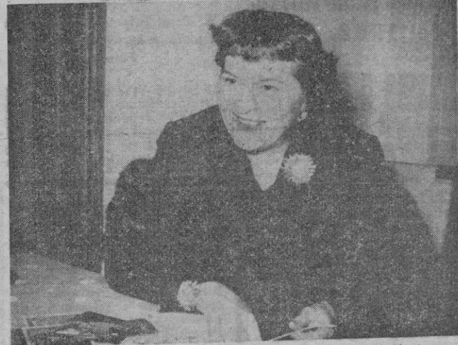
Dos momentos de la entrevista en el Hotel Maricel