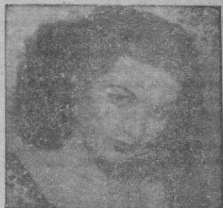
IVONNE DE CARLO

"Casbah", indiscutiblemente, cumple con su cometido. Dicho esto puede añadirse también que se trata de una buena película,