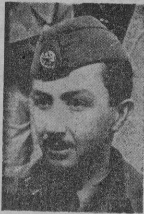
S. A. R. el Principe Abdul Ilah, regente y heredero del Irak

El príncipe Abdul Ilah visitó en 1945 los Estados Unidos, Canadá e Inglaterra, donde fué huésped del Presidente Truman y del rey Jorge.