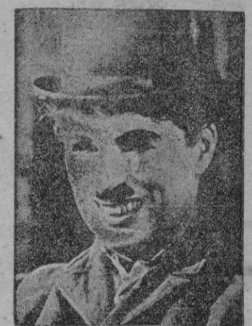
Este es el título de una serie de reportajes que, adquiridos en exclusiva, comenzamos a publicar en breve.