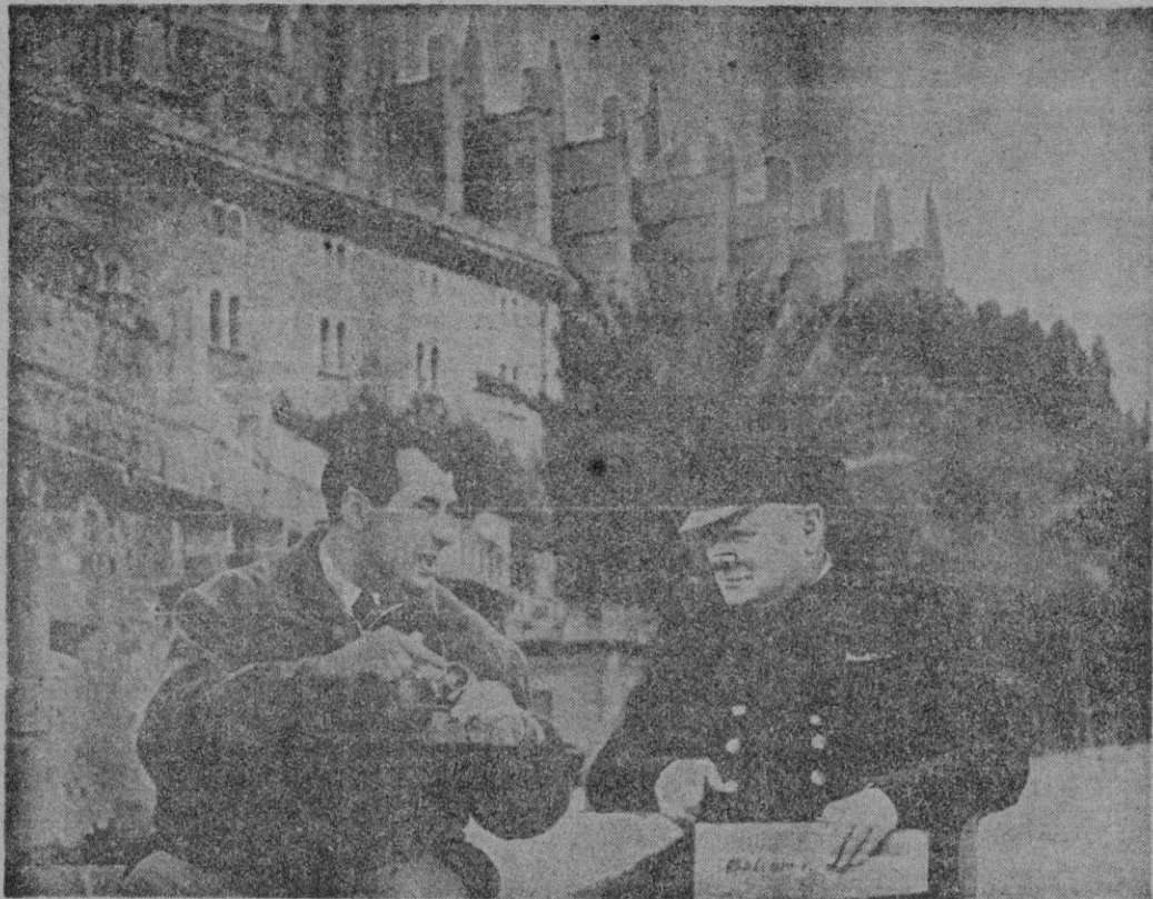
Mr. Churchill, que ha visitado nuestra Catedral, descansa un momento en un banco de nuestras viejas murallas, tras haber invitado al fotógrafo Planas a que le impresionara con su Leyka una panorámica de nuestra incomparable bahía, en la que aparece surto, el yate yanqui «California». Mr. Churchill, amante de la buena prensa, acaba de comprar un ejemplar de nuestro periódico (CONTINUA EN 4.ª PAGINA)

A bordo del yate «California».—Junto a la Catedral.—Camino de Formentor