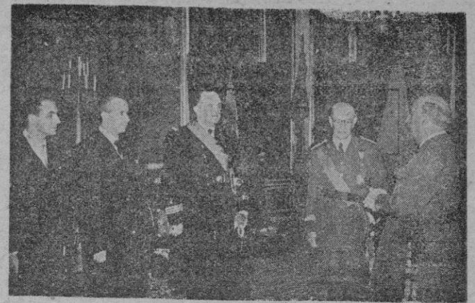
Madrid.—S. E. el Jefe del Estado durante la audiencia concedida a la Junta de Energía Nuclear, presidida por el Teniente General Jefe del Alto Estado Mayor, don Juan Vigón.