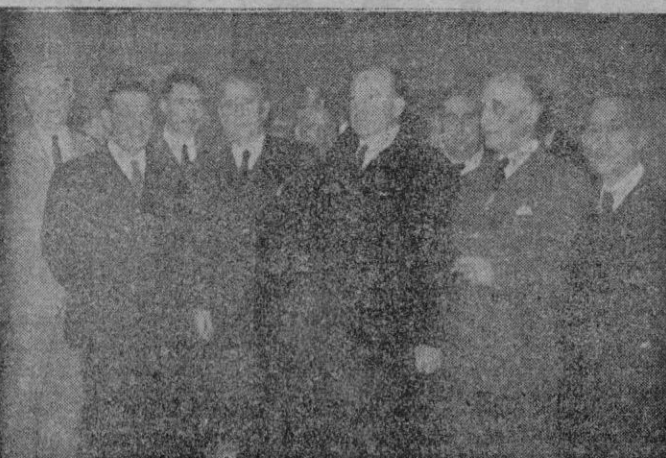
Un grupo de nuestras Primeras Autoridades que asistieron a la fiesta. El Capitán General, el Almirante y el Alcalde, acompañados del Presidente del Círculo Mallorquín

En el espléndido marco del gran salón de fiestas de nuestro Casino tuvo ayer lugar la fiesta inaugural del serial que tiene proyectado en celebración de su centenario.