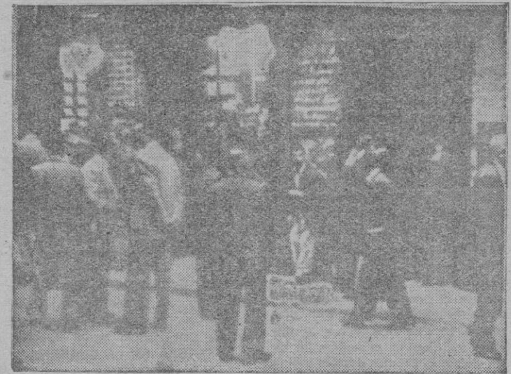
La Administración, concurrida de agraciados y aspirantes a capitalistas

Han correspondido a los números: 7.738, 15.653, 19.043, 26.688, 42.098, 28.308, 42.417, 49.560.