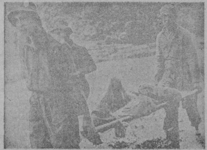
La triste y monótona actualidad coreana vuelve a mostrar su horror a través de esta fotografía: un soldado inglés, ayudado por un chino prisionero, transporta hacia el botiquín a un combatiente herido durante los últimos combates.