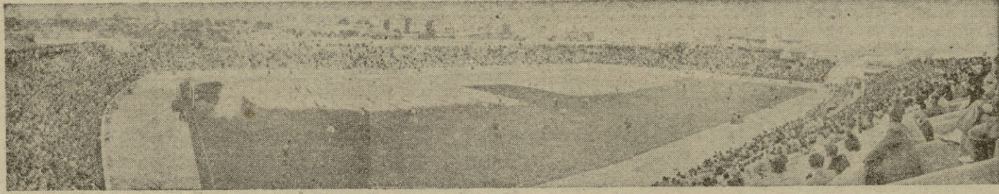
La afición está nuevamente con el Mallorca. Aquí Juanet ha captado en esta preciosa panorámica el gentiayo que se congregó en "Es Forti" con motivo del Mallorca-Alcoyano.

Pero el secreto de todo estuvo en el señor Balcells. Para él han de ser hoy nuestros mejores elogios. Su equívoca actuación, sus cientos de faltas en contra del Mallorca por unas poquísimas docenas a favor, la concesión de aquel gol primero al Alcoyano, cuando se había metido por las buenas y con las manos al portero en la meta con el balón bloqueado maravillosamente colmaron la paciencia del condescendiente público de "Es Forti" que al verse de tal manera engañado empezó a protestar y a animar al equipo de casa a decirle "adelante Mallorca" "Estamos contigo Mallorca" "El Mallorca es de la Isla" "El Mallorca es nuestro". Y aquellos muchachos que llevan una temporada formidable, plétóricos de euforia y de moral al sentir el golpe en la espalda del amigo, redoblaron sus esfuerzos,