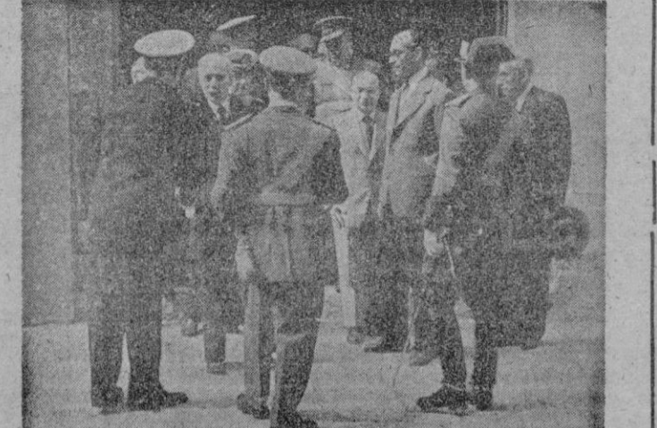
Dos aspectos de los actos celebrados en esta ciudad, con motivo de la Fiesta del Pilar, Patrona de la Guardia Civil y del Cuerpo de Correos. (Amplia información en página segunda)