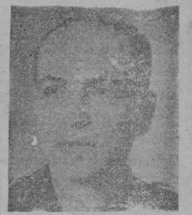
DELEGADO NACIONAL DE SINDICATOS. — José Solís Ruiz, cuya magnífica labor en Pontevedra y Guipúzcoa avala su futura tarea en la Delegación Nacional de Sindicatos