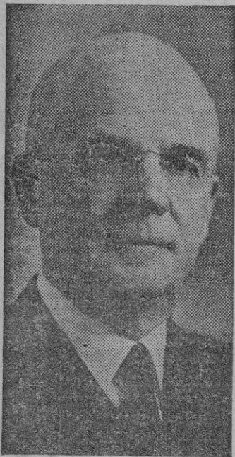
Francis P. Matthews, Embajador de los Estados Unidos en Irlanda. Cod anterioridad fué Secretario de Marina.