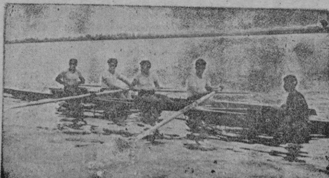
Macon. — He aquí a la embarcación española en la semifinal de la prueba de cuatro remeros en el río Saone, correspondiente a los Campeonatos Europeos de Remo.

ESPAÑA EN LA SEMIFINAL DE LOS CAMPEONATOS EUROPEOS DE REMO