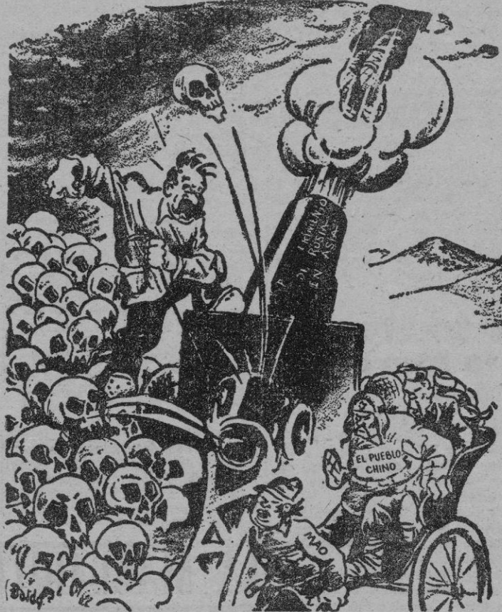
[DEL DIARIO "THE ATLANTA CONSTITUTION", DE ATLANTA, E.U.A.]

M. R. d'Auxion de Ruffé, se declara en términos parecidos en sus obras. DOJ SANTOS