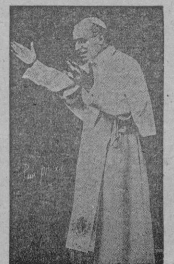
ta por él en ocasión de la proclamación del dogma. Esta noche el Padre Santo se dirigirá al mundo a través

Fuerzas "invasoras" en masa se lanzarán contra esta isla. Los detalles de cualesquiera operaciones son secretos; tienden los ejercicios a probar la seguridad de Malta; Sicilia y parte meridional de la península italiana, por una parte y por otra la "línea vital marítima" que por el Mediterráneo conduce del Atlántico al Oriente medio y el cordón de aeródromos que en el Noroeste de África construyen los Estados Unidos. — Efe.