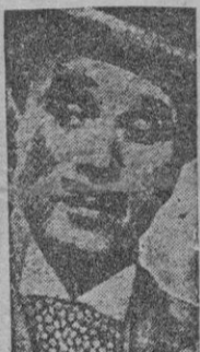
Celebridad de su padre de Vd. se debe a que nadie le comprende. — Efe.

ningún trámite ni entregar la tarjeta de abastecimientos y colección de cupones a dependencia alguna. — Cifra.