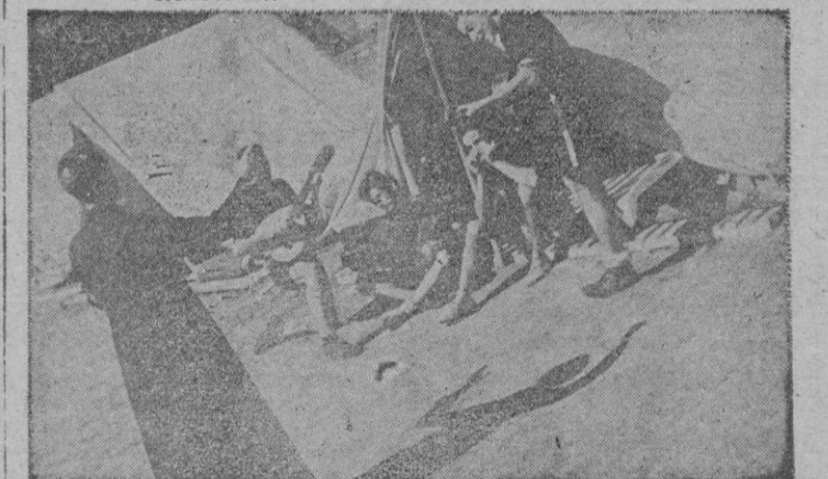
Un momento de alegría en el Campamento, en el que también toma parte el capellán del mismo