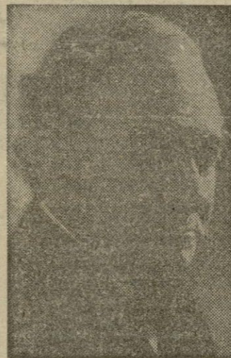
TOM CONNALLY, Senador de los EE. UU. por el Estado de Texas.

Atracó el buque en el muelle del Club Náutico.