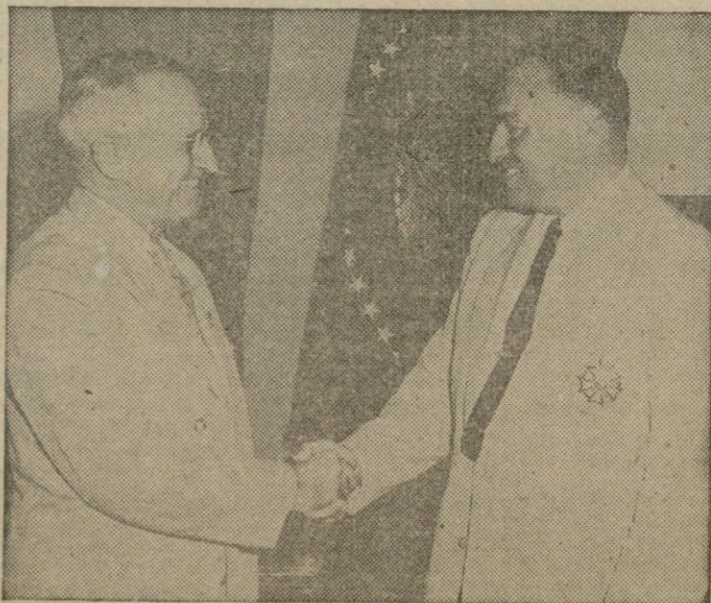
Durante la reciente visita a los EE. UU., el Presidente del Ecuador, Sr. Galo Plaza, recibe de manos del Presidente Truman la Medalla del Mérito por su excepcional contribución para la defensa del continente americano.