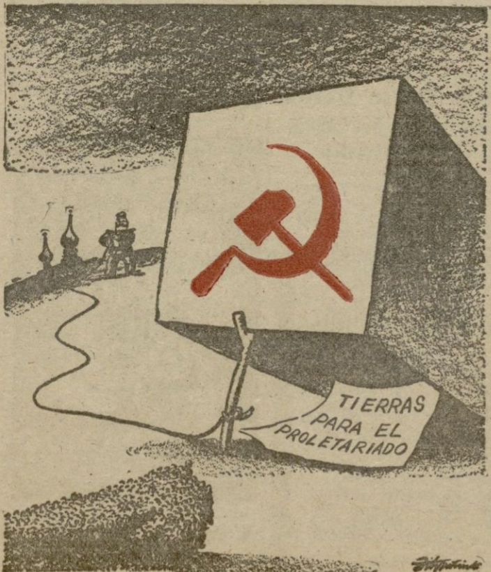
DEL DIARIO "THE ST. LOUIS POST-DISPATCH" DE ST. LOUIS, MISSOURI, E. U. A.