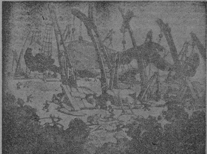
Apresamiento de Gulliver, cuando los liliputienses le encuentran desmayado en sus playas.

En ese caso, esa inferioridad está totalmente justificada. La de la estatura, claro.