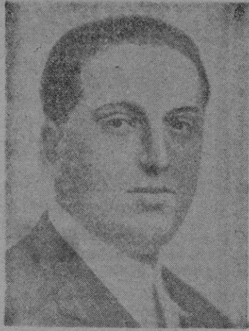
JOSE CALVO SOTELO

Ayer se cumplieron tres lustros del vil asesinato por las hordas gubernamentales del insignia patrio y hombre de Estado, José Calvo Sotelo. Lo primero que quema la memoria el recuerdo de aquel luctuoso día que se hizo página de Historia es el dolor profundo que sintió en todos sus nervios el cuerpo sano de la patria; y la dolorosa ampolla de la otra quemadura fué el miedo cerval que heló los huesos del viejo esqueleto de la España confiada y burguesa, desamparada definitivamente de todo favor oficial.