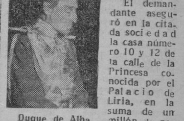
Duque de Alba

Madrid 29. — Por el incendio del Palacio de Liria, la sociedad aseguradora "Antigua Sociedad de Seguros Mutuos de Incendios y Casas" ha sido condenada a indemnizar al Duque de Alba.