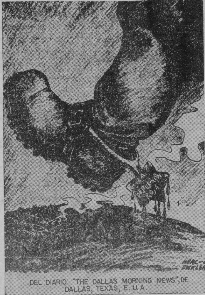
DEL DIARIO "THE DALLAS MORNING NEWS", DE DALLAS, TEXAS, E. U. A.

Si los sentimientos de pacificación y tolerancia deben ser universales y sin distinción de regímenes, si los jefes de estado en litigio frío-bélico, si los políticos mediadores de grandes con-