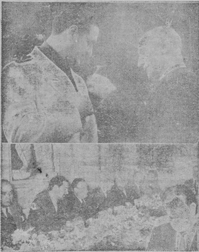
Arriba: En el Salón de Sesiones el Ilmo. Sr. Alcalde le impone la Medalla de Oro de la Ciudad. — Abajo: La presidencia del banquete en que fué obsequiado en el Riskal

(INFORMACION DE ESTOS ACTOS EN SEGUNDA PAGINA)