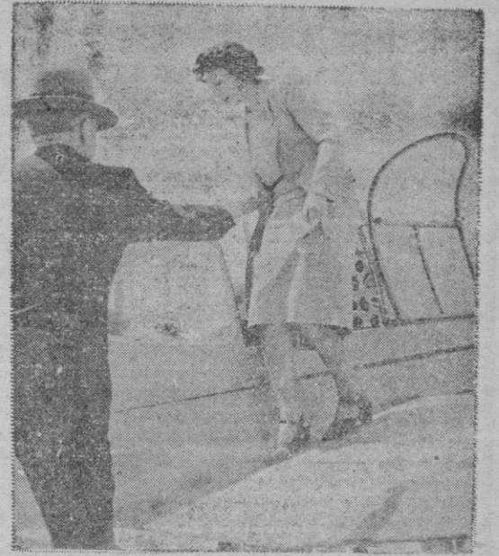
Madrid. — Procedentes de Bilbao, han llegado al aeródromo de Cuatro Vientos las avionetas que tomaron la salida en la capital vizcaína para cubrir la primera etapa del "raid" internacional del Real Aero Club de España. He aquí a una bella señorita participante, fotografiada junto a la avioneta que tripulaba, a los pocos momentos de tomar tierra

A última hora el Presidente recibirá al Secretario de Defensa, General Marshall, que acaba de regresar de Extremo Oriente. — (Efe).