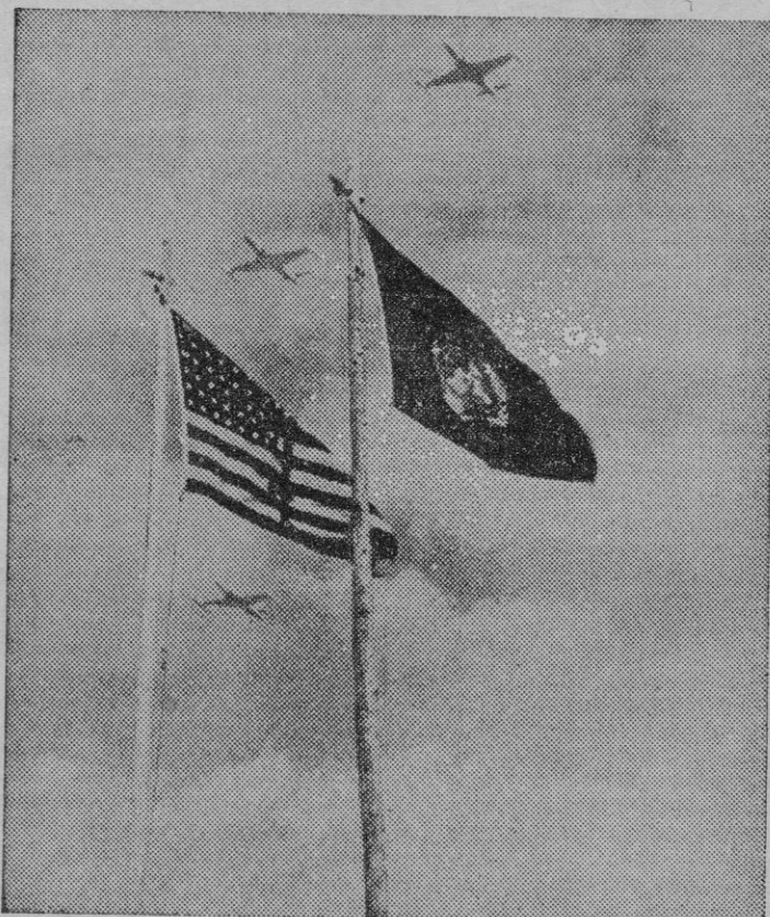
Sobre las banderas de paz, cazas de guerra F-80

El tono discursivo de los políticos, alcanza su efervescencia en los instantes agudos en que llega a un principio de acuerdo. Mientras exista desacuerdo, todo marchará por tonos más o