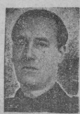
terés para esta ciudad. Cifra.

Madrid, 1. — El Delegado Nacional de Sindicatos, Sr. Sanz Orrio ha clausurado el pleno del Consejo Económico Sindical, en el que han sido aprobadas varias ponencias de gran interés para esta ciudad. Cifra.