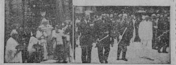
He aquí dos momentos de la solemne festividad de ayer, dedicada al Sagrado Corazón de Jesús, cuya procesión fué presidida por nuestras primeras autoridades. (VEA INFORMACION EN PAGINAS INTERIORES)