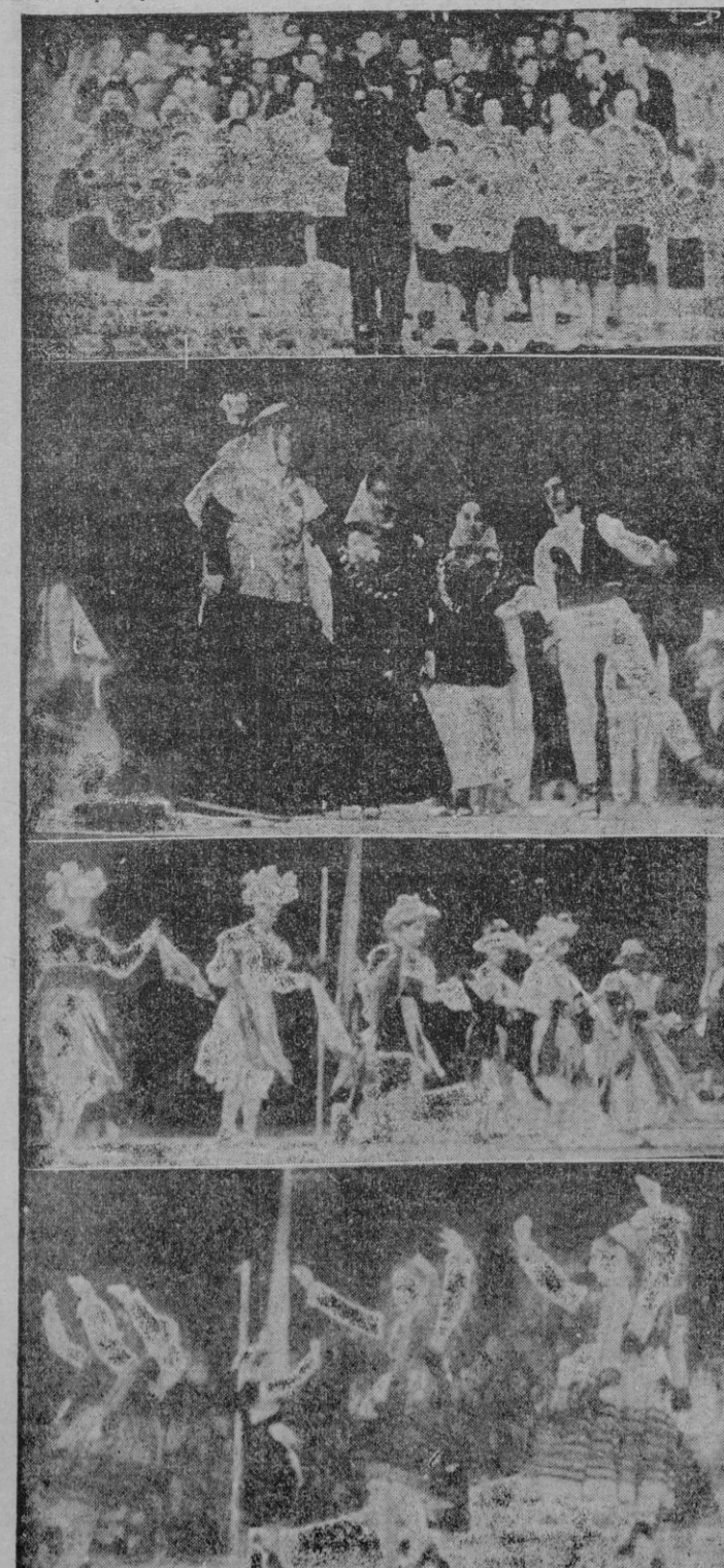
La Coral Polifónica, en su actuación del jueves. — La agrupación ibicenca, durante su brillante actuación. — Los "cossiers" de Algaida. El grupo de la Sección Femenina de Llanes (Asturias).

En la campaña actual, cosecha muy corta, las exportaciones de oliva alcanzaron la cifra de 40 mil toneladas y las importaciones, de 80.000 toneladas sin precedentes por su magnitud en nuestra economía. La aportación a favor del consumo será de 40.000 toneladas, cifra que por sí misma es de gran importancia.