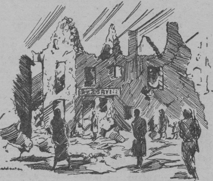
Inglaterra quedaria eliminada con pocas bombas atómicas...

sus esfuerzos y procederá a la guerra preventiva en el momento en que el acortamiento de la fuerza combativa del Occidente empiece a poner en duda la superioridad militar soviética. Otra actitud pondría a Moscú en el pe-