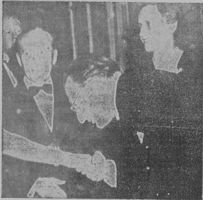
De Gasperi, cuyo partido triunfará

La segunda fase de estas elecciones administrativas se espera con la mayor confianza. El 10 de junio próximo, el Norte de Italia y en el otoño el resto de la península — la excepción es Sicilia, dentro de cuatro días —, se vuelve a la votación. Mas son las actuales las que junto con