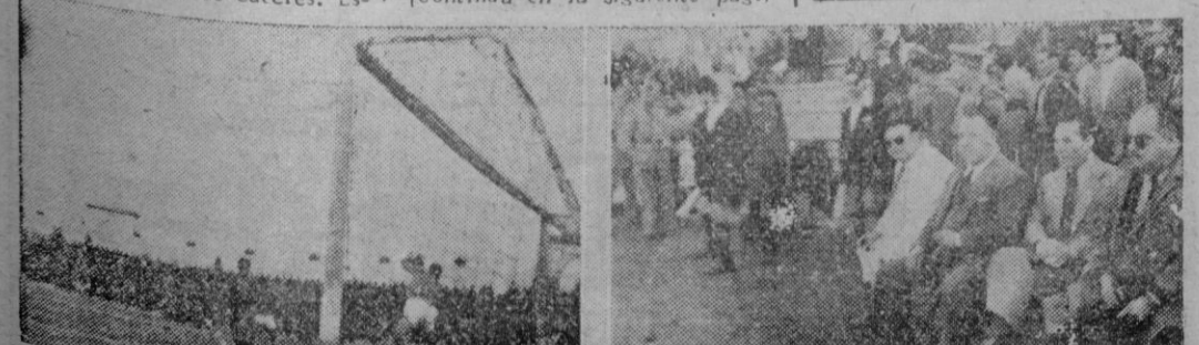
Una buena intervención de Calpe, a un tiro de los delanteros del Cacereño. — Y en la banda los "mandos" de la excursión, junto con nuestro Redactor Deportivo