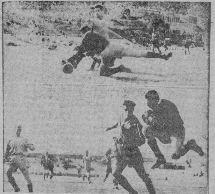
Dos intervenciones del meta del "Badalona" durante el acoso — que duró todo el partido — de los delanteros mallorquinistas. — (Fotos "Juanet")