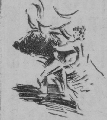
Un "capitalista" en el ruedo