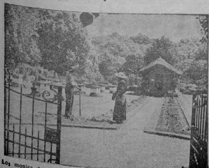
Los monjes de la Abadía de Bucfast, considerados como una de las primeras autoridades del mundo sobre la apicultura