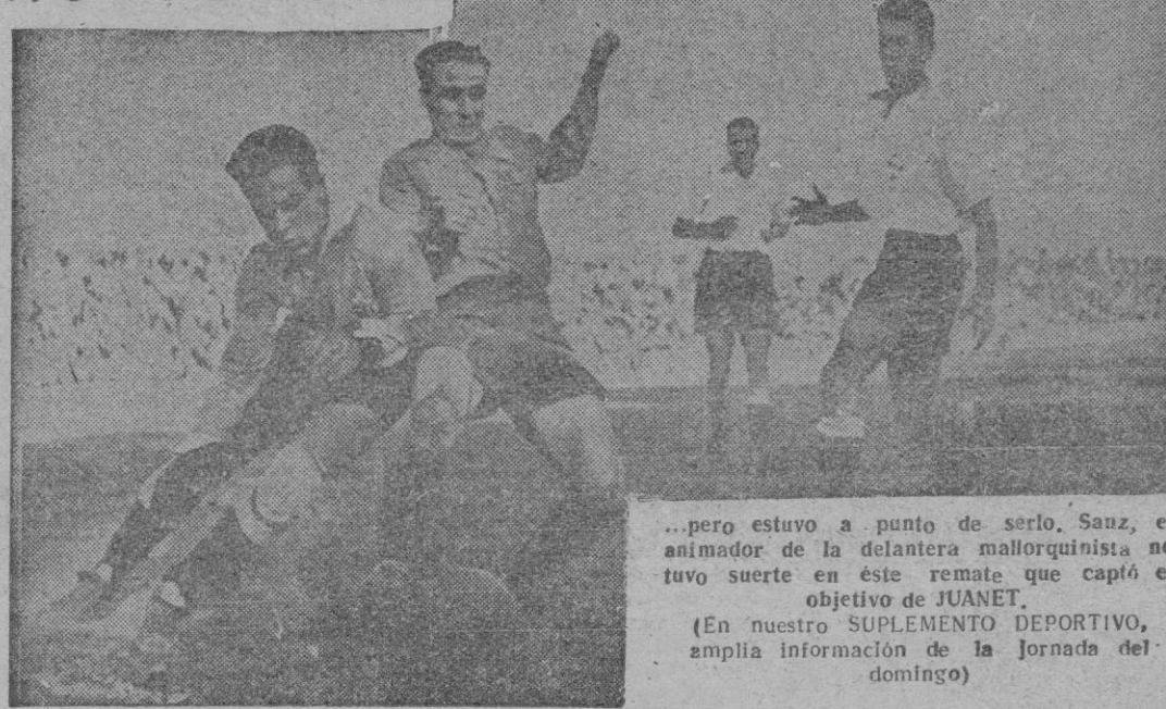
...pero estuvo a punto de serlo. Sanz, el animador de la delantera mallorquina no tuvo suerte en este remate que captó el objetivo de JUANET. (En nuestro SUPLEMENTO DEPORTIVO, amplia información de la Jornada del domingo)