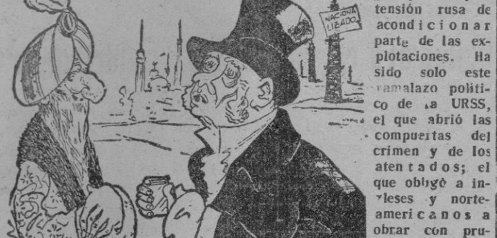
JOHN BULL. — ¿No podría darme siquiera para el encendedor?

El peligro de una intervención rusa en el Oriente Medio daría al traste con el petróleo persa, elemento vital para Inglaterra. Con el abastecimiento de Persia, aparte de que el 75 por 100 del petróleo consumido en Europa, procede de Persia, de tanto volumen productor como Rusia. Ante el problema de la nacionalización, es Norteamérica la que fija bien la atención a los hechos. Persia, al borde de la ruina, sin poder pagar siquiera a los funcionarios, es una fruta madura que pudiera, a pesar de la utopía nacionalista — porque esto y no otra cosa es la nacionalización del petróleo —, caer en manos comunistas.