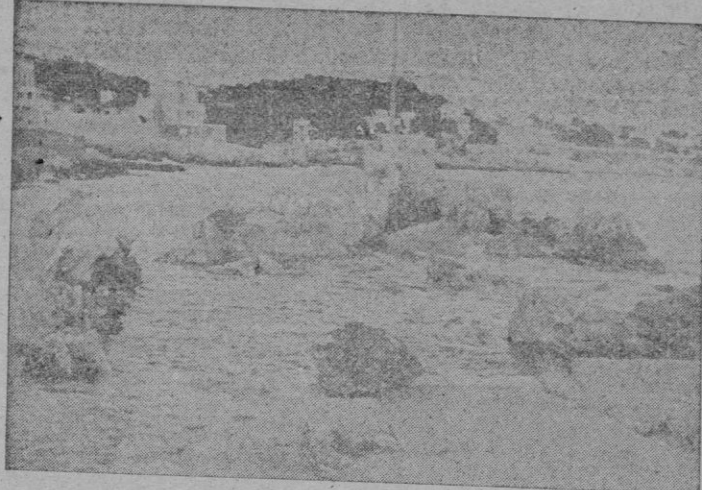
Estado en que quedó el puerto de "Cala Nova" después del temporal del miércoles de la pasada semana