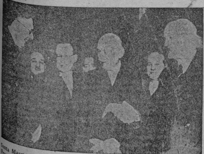
Santa Margarita (Italia). — Los Ministros de Relaciones Exteriores de Francia e Italia, Schuman y Sforza, se saludan a la llegada de la delegación francesa a esta localidad para dar comienzo a las conversaciones entre los primeros ministros de ambos países Plevin y De Gasperi, que aparecen a la izquierda de la foto.