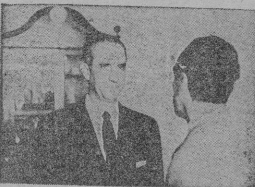
camilla, la chimenea al fondo, fotografías, pinturas, butacones... Todo envuelto en un tono cordialísimo, repleto de señorío y de simpatía, de los señores Gomá.

—Mi Coronel: Venimos a que nos hable de la conferencia que va a pronunciar en los Seminarios de Formación de Falange.