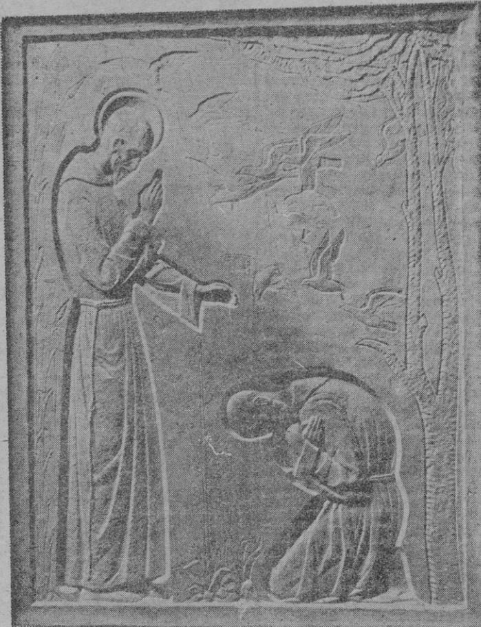
Relieve del Colegio de San Francisco, por el escultor Jaime Mir

El escultor Jaime Mir trabaja intensamente en diversos importantes encargos para el nuevo colegio de los Padres Franciscanos. La última obra salida de su taller es un relieve que acaba de ser colocado encima del portal del zaguán que da acceso al vestíbulo de dicho colegio. El relieve, labrado en piedra, representa al Santo de Asís bendiciendo a un fraile postrado a sus plantas. Una teoría de palomas, hábilmente, primorosamente ensortijadas, al tiempo que equilibra la composición, le presta un aire discretamente decorativo sin perder un adarme de su significación simbólica, de hondo contenido espiritual.