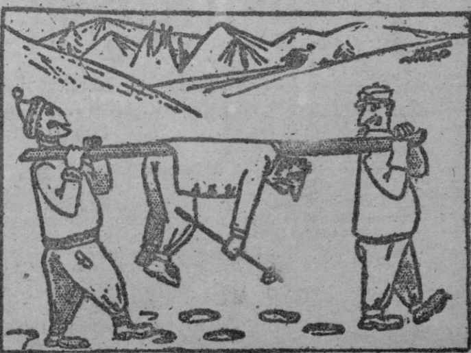
—Siempre andamos con la misma penuria de material sanitario...

Londres 7. — El diario moscovita "Pravda" dice en un editorial que los Estados Unidos sabotean deliberadamente las negociaciones que sobre el préstamo y arriendo están celebrando en Rusia, al tratar de imponer "condiciones inaceptables y abusivas" al soviét.