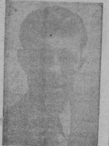
SOLE Actual entrenador del "Melilla"

El domingo en el campo de Es Forti va a disputarse un encuentro interesantísimo contra el Melilla. El equipo marroquí no es de los que en la tabla clasificatoria vayan mal clasificados; es más, le