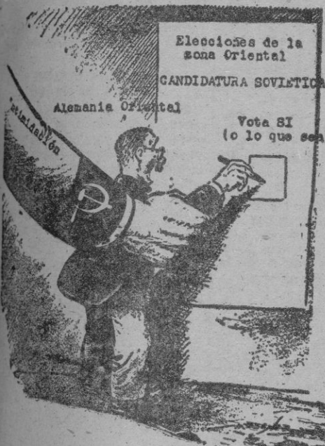
"Es que las elecciones "libres" en la zona oriental de Alemania no son una flagrante violación de los derechos humanos...?"

Un estudio del texto parcial de la nota rusa nos lleva de la mano a encontrar, sobre el tipismo, el cinismo, De entrada, ya, obsérvese el sentido de la redacción: "Ya que el Gobierno francés, al igual que el de Gran Bretaña y los Estados Unidos han declarado que aspiran a una paz permanente de las relaciones entre Francia, Gran Bretaña, Estados Unidos y la Unión Soviética..." "asi como a la eliminación de las causas de la tensión internacional actualmente existente..." "el Gobierno ruso estima que no existe ninguna razón para aplazar más la reunión del Consejo de Ministros de Asuntos Exteriores..."