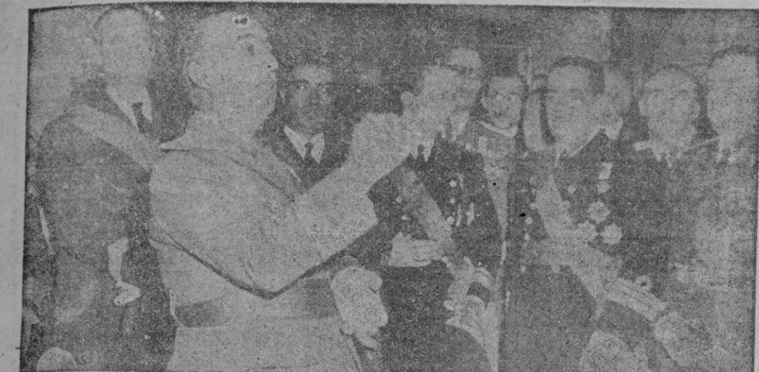
Madrid. — Presididas por los Ministros del Ejército, Marina, Aire, Gobernación y Justicia, acudieron al Palacio de El Pardo nutridas representaciones de todas las Armas y Cuerpos del Ejército, para saludar a S. E. el Jefe del Estado, con motivo de la Pascua Militar.