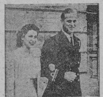
LOS DUQUES DE EDIMBURGO

Atenas 12. — La Princesa Isabel de Inglaterra, acompañada de su esposo el duque de Edimburgo,