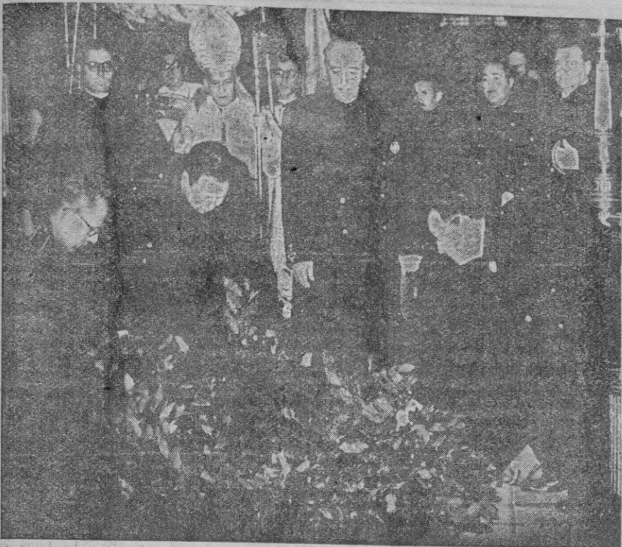
San Lorenzo de El Escorial. — S. E. el Jefe del Estado, acompañado de varios Ministros y personalidades, coloca la corona de laurel sobre la tumba de José Antonio Primo de Rivera, momentos antes de dar comienzo el solemne funeral en memoria del Fundador de la Falange, en el XIV aniversario de su muerte.

Attlee dijo que han prometido su asistencia los primeros ministros de Canadá, Australia, Nueva Zelanda, India, Pakistán, Ceylán e Indonesia. — Efe.