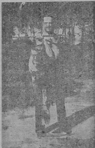
No se trata de el título de una historia, se trata de una fotografía del gran deportista Mus, y el mero de 23 kilos que consiguió pescar, y de cuya hazaña ya dimos cuenta en una de nuestras ediciones anteriores.