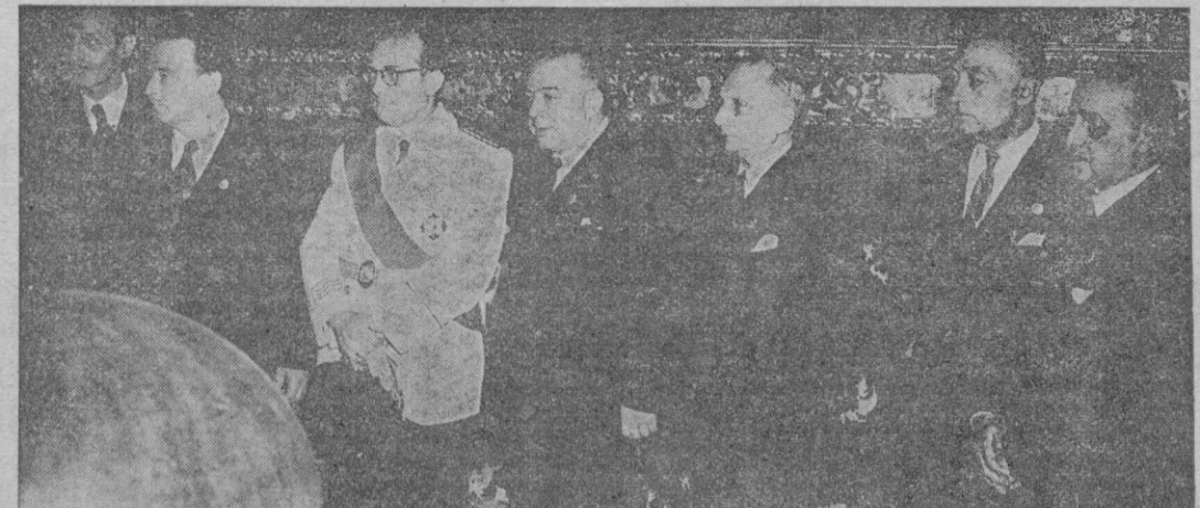
Madrid. — El Ministro de Educación Nacional, con el Presidente de la Sociedad de Autores de España y otras personalidades, en el Palacio del Consejo Nacional, donde se celebró la apertura del XVI Congreso de la Confederación Internacional de Sociedades de Autores y Compositores.