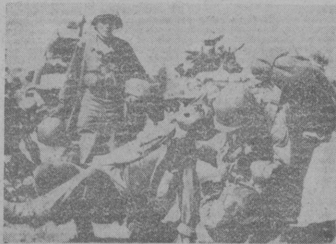
Taejon. — Este soldado norteamericano que conduce al puesto de socorro a un compañero herido, no ha podido resistir, a pesar de los esfuerzos realizados, por encontrarse también herido, y con un gesto de dolor suelta al compañero que transportaba, cayendo ambos al suelo, mientras otros compañeros acuden para ayudar a los camaradas de armas.

Estuvimos muy cerca de la guerra durante el bloqueo de Berlin