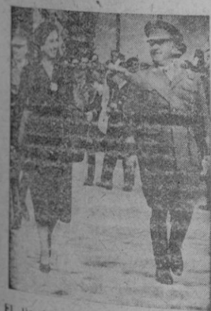
El Pardo.—Su Excelencia el jefe del Estado se dirige con su esposa para asistir a la ceremonia religiosa celebrada con motivo de la fiesta onomástica en El Pardo, entre las aclamaciones de la población.

FIESTA ONOMASTICA DE S. E. EL JEFE DEL ESTADO