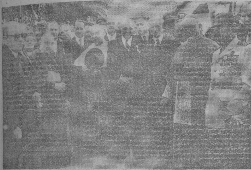
Elvas (Frontera portuguesa). — El Legado de S. S. Monseñor Cerejeira, acompañado del Presidente de las Cortes, Ministros de la Gobernación y Justicia y otras personalidades españolas que asisten a dichos actos conmemorativos en la patria del Santo, durante el recibimiento que las Autoridades portuguesas les hicieron en esta ciudad fronteriza.

ACTOS DEL IV CENTENARIO DE SAN JUAN DE DIOS