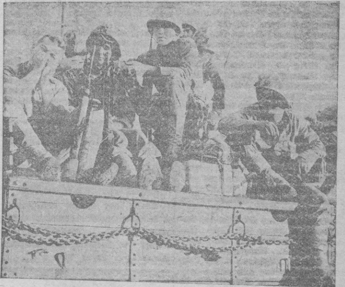
Tropas yanquis en Corea del Sur, dirigiéndose a los últimos frentes de lucha

Tokio 3. — Un comunicado del Cuartel General anuncia que la tercera división surcoreana ha alcanzado Tongheori, a 20 kilómetros al Norte del paralelo 38. — (Efe).