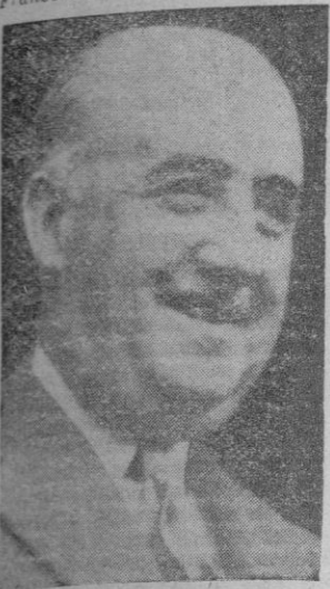
España, la gran familia de la Falange Española Tradicionalista y de las JONS, unida en

HOY celebra su onomástico nuestro Jefe Nacional Francisco Franco Bahamonde, Caudillo de