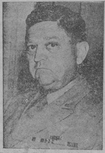
Tokio. — El Teniente General Walker H. Walker que ha asumido el mando de las fuerzas norteamericanas en Corea. Hasta ahora era el jefe del 8.º Ejército norteamericano.

Yongdok fue ocupado por los comunistas hace dos días, cuando una pequeña unidad norteamericana lo reconquistó. —(Continúa en cuarta pág.)