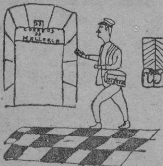
UN CARTERO por Arnaldo Amengual 12 años