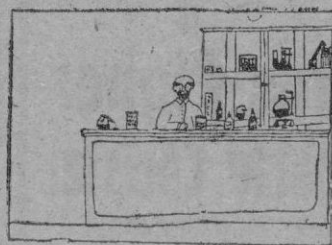
FARMACEUTICO por Miguel J. Arbona 11 años