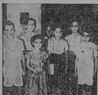
El simpático grupo de participantes en nuestro último Concurso en el acto de la entrega de obsequios

CONCURSOS. — CONCURSOS. — CONCURSOS. — CONCURSOS