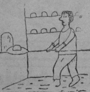
PANADERO por S. Pérez, 8 años