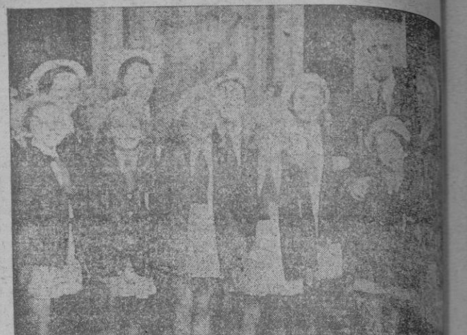
Las niñas del País de Gales, junto al Alcalde de Palma, en la recepción celebrada ayer.