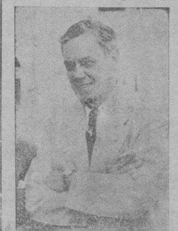
Málaga.— El popular compositor cubano don Ernesto Lecuona, que se encuentra en España.