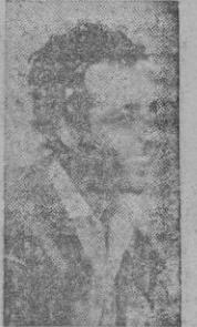
Marie Dea Fernando Rey

Este es el comentario que nos inspira el nuevo film del interesante director Rafael Gil. B.