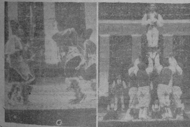
El grupo de danzas de la Sección Femenina de Castellón. — Una exhibición del grupo de Oldarra (Francia).