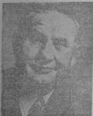
BEVIN Hizo imposible la unión económica de Europa

isla han vivido de sus fábricas y de sus oficinas, y este régimen de vida se les hace cada día más difícil porque los millones de hombres de su imperio, que encontraban normal esta situación, hace tiempo que han empezado a considerarla poco satisfactoria y a pensar que ellos pueden, perfectamente, disponer de sus propias fábricas y de sus propias oficinas, al margen de las oficinas y fábricas metropolitanas. Este cambio indudable de las cosas ha apretado el cinturón de Inglaterra, que ya no es hoy el pueblo señor de otros clasificados entre los servidores y los esclavos, y día llegará en que el cinturón económico de la metrópoli cinda y reduzca más las cinturas inglesas. Este límite es el que hay que ponerle a la razón inglesa de Mr. Bevin, y este horizonte oscuro a sus esfuerzos y a sus esperanzas. Explicable, es, no obstante, que Mr. Bevin se esfuerce y se espere, pero equivocado de principio a fin.