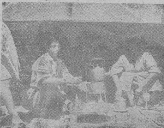
Madrid 19.—Un grupo de 16 árabes nómadas del Desierto del Sahara Español, reside desde hace unos días en la Casa de Campo, de Madrid, para representar a sus hermanos de raza en el Pabellón de la Dirección General de Marruecos y Colonias en la I Feria Nacional del Campo. Estos árabes del desierto, se han acostumbrado pronto al clima madrileño y realizan normalmente sus costumbres típicas y sus juegos en espera de la inauguración del Certamen.