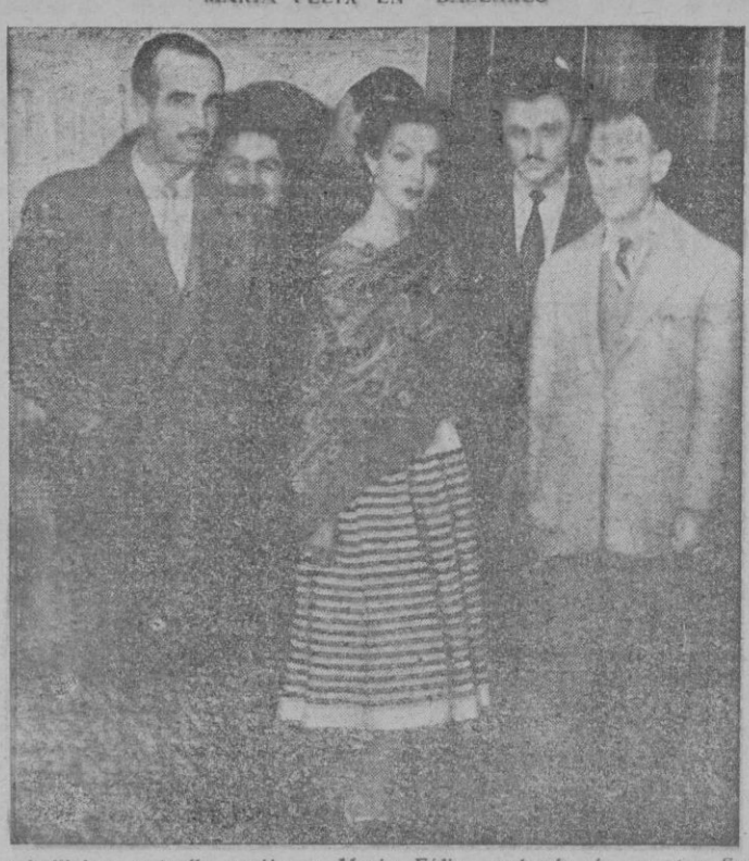
La bellísima estrella mejicana Maria Félix, rodeada de nuestro Sub-director, Redactor-Jefe, Critico cinematográfico y dos Redactores, durante la visita que hizo el sábado pasado a BALEARES