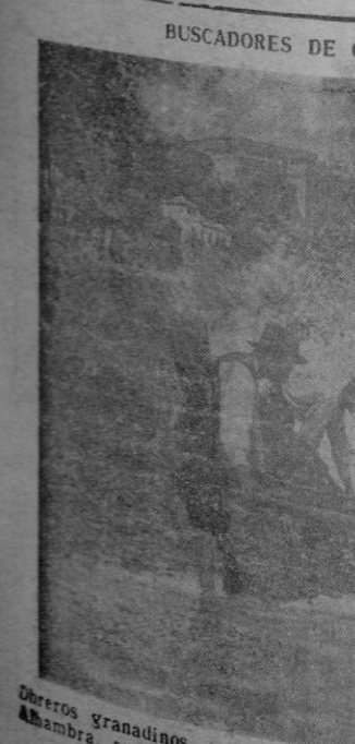
Trabajadores granadinos, teniendo como fondo el palacio morisco de la Alhambra, se dedican a cerner las arenas auríferas que arrastra el río Darro.

Mejoramiento físico y sana formación, logran las niñas españolas en los albergues de las Juventudes de a Sección Femenina.