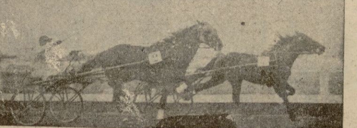
Los Excmos. Sres. Gobernador Civil; General Gobernador Militar y General Jefe de la Cria Caballar, en la entrega de Trofeos a los vencedores en las diversas pruebas. Abajo, la emocionante llegada en la carrera del Gran Premio Nacional.