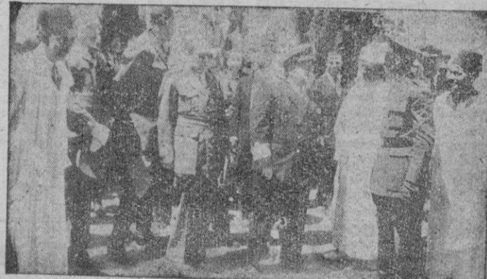
Valencia. — El Almirante Basterreche, en representación del Jefe del Estado, acompañado de las Autoridades, durante su visita al pabellón marroquí.