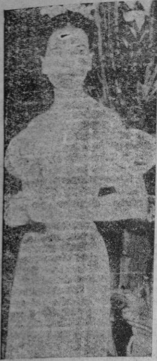
Roma.— La Marquessa de Villaverde durante la recepción de gala celebrada en la Embajada de España en Roma.