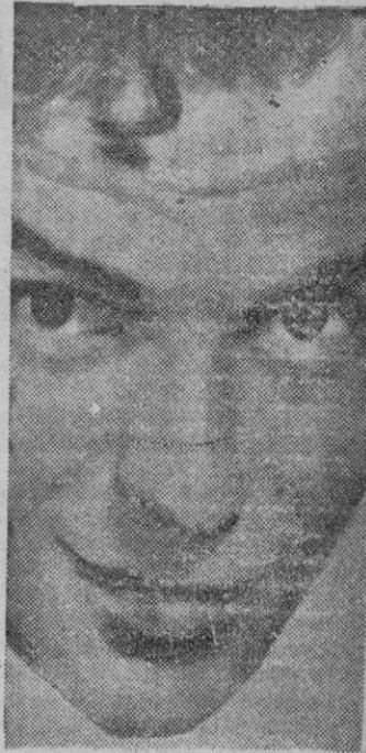
Frank Sinatra—el de la foto—será Frank Sinatra y toda la pesca, pero Mario Cabré, es Mario Cabré, matador de toros, poeta, actor cinematográfico y un "don Juan" que vale lo menos por cuatro.

Lea en página 7 la rivalidad amorosa surgida entre el famoso cantante y el valiente torero. En juego está el corazón de Ava Gardner.