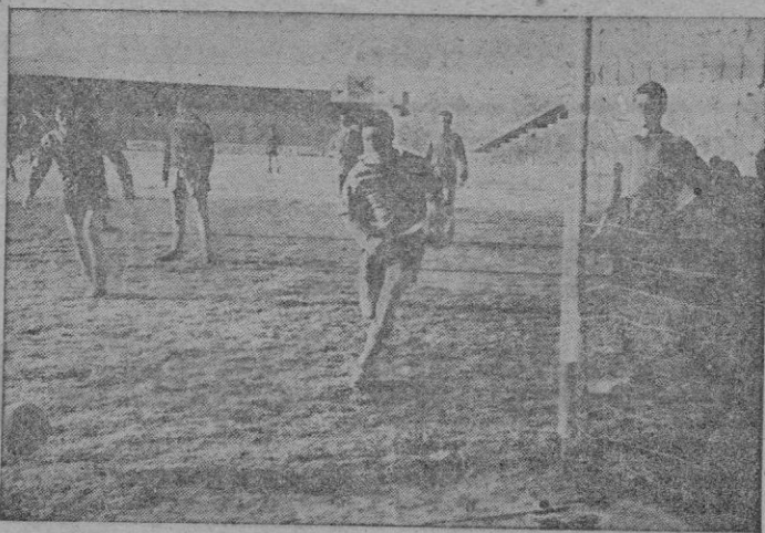
Un momento del entrenamiento de ayer tarde en Es Forti, realizado por los jugadores chilenos.