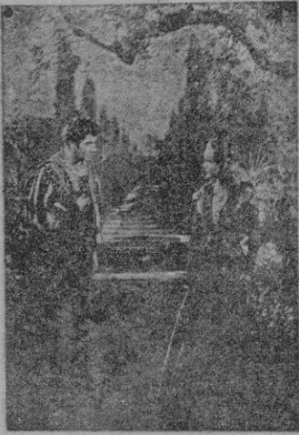
Una escena del film

Y es el ambiente, la puesta en escena interesante y de muchas calidades, la que la hace diferente, proporcionándole ese aire preciso de justeza ambiental, buen verismo, poca teatralidad o ninguna para ser verídicos.