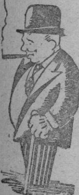
CHURCHILL "Europa sin Alemania está perdida".

LAMPARA "Z" PREFERIDA EN LOS SERVICIOS DE LOCOMOCION POR SU GRAN RESISTENCIA