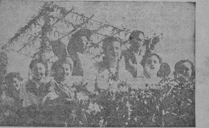
Murcia. — Carroza del Perráneo, durante el desfile del "Bando de la Huerta", tradicional festejo que se celebra en esta capital con motivo de las fiestas de Abril.