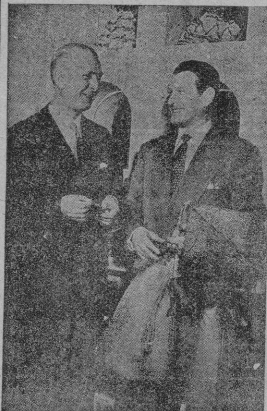
Nueva York. — El Director General de Turismo de España D. Luis A. Bolin, conversando con el torero norteamericano Sidney Franklin, durante el solemne acto inaugural de la Oficina de Turismo Española en la gran urbe norteamericana.

INAUGURACION DE LA OFICINA DE TURISMO DE ESPAÑA EN NUEVA YORK