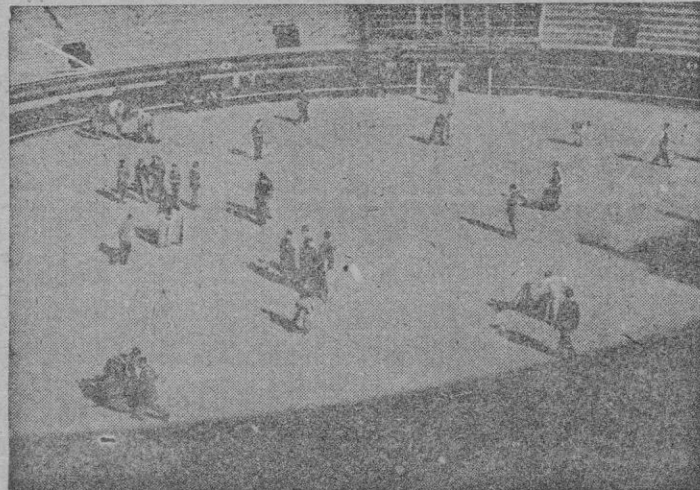
La plaza parecía un jardín de reboleras, verónicas y chicuelinas. Más de cuarenta chavales se entrenaban por grupos, con más pasión que si hubiera sido una tarde de alternativa. Primero la gloria de un faenón, después a hacerle de toro al compañero. ¡Un poco cada uno, amigo!

—¿Y la segunda parte? —La sección de "neofitos", naturalmente la más numerosa, intervendrá en la segunda parte, en la que se correrán becerros embolados, que serán devueltos a los corrales después de haber simulado con ellos todas las suertes del toreo. —¿Se presian!... —Desde luego, si se presian. —¿No tiene una tendencia excesivamente deportiva vuestra plan? —En las grandes capitales sin duda la afición taurina es suficientemente numerosa para no tener que apelar a la pasión de los "puntos". La fiebre de los toros es un espectáculo tan grandioso que se sostiene por sí solo. Pero aquí, mas que en cual-