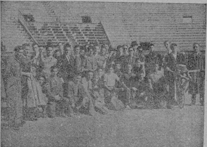
Grupo de organizadores y alumnos de la Escuela Taurina Balear