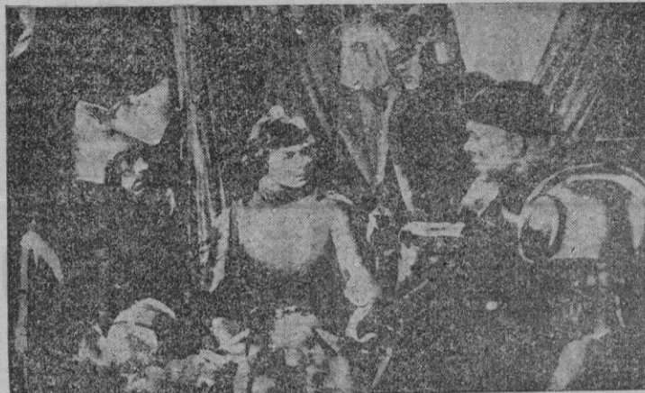
Una escena de "Juana de Arco"

Un gran espectáculo, esto es la versión cinematográfica de la obra teatral de Maxwell sobre la Doncella de Orleans. Un bellissimo espectáculo, claro.