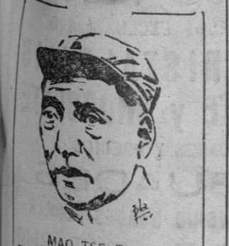
MAO TSE TUNG

Londres 16. — Radio Moscú anuncia la llegada a la capital soviética del dirigente comunista chino, Mao Tse Tung. — Efe.