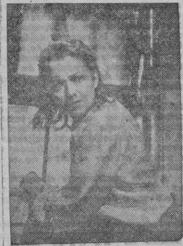
Olivia de Havilland