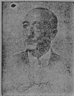
W. FERNANDEZ FLOREZ

DESCOCEMOS los motivos en que se ha fundado el secretario del ministerio de Alimentación inglés, doctor Summerskill para afirmar públicamente que comer carne representa tan sólo una manía, un prejuicio que no merece ser considerado en serio. Sabemos, sí, que lo que se intenta con esas palabras es reducir la apatía que los ingleses tienen por el "rosbif"; pero el procedimiento es extraño y nos gustaría saber cómo el doctor apoya su teoría. Una cosa es decir: "no podemos comer carne", y otra asegurar: "no debemos comer carne". El sistema de que se vale Mr. Summerskill está a un paso del hipnotismo. No puede dudarse de que el político que consiguiese hipnotizar a un pueblo resolvería hasta la perfección todas las dificultades que ofrece el deber de administrarlo bien. Cuando no hubiese carbón, le sugestionaría hasta hacerle sudar, cuando las calamidades afligiesen a la comunidad despertaría ideas hilarantes en ella, tal como hemos visto hacer en los escenarios y en las pistas del circo a los hipnotizadores que se ganan la vida trabajando en público.