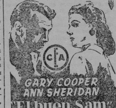
GARY COOPER ANN SHERIDAN El buen Sam

tendrán el honor de presentar Mañana GRAN GALA ARISTOCRÁTICA UN GRAN EXITO UNIVERSAL