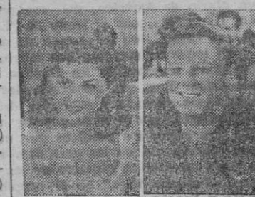
Esther Williams - Van Johnson

Esther Williams es muy guapa—¡vaya un descubrimiento!—, tan guapa como rosa actriz. Sabiendo esto, ¿qué asunto le iría bien sin ponerla es un brete? La novela rosa cinematográfica, parece hecha a la medida.