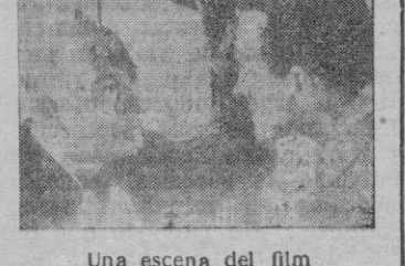
Una escena del film

Maurice Tourneur ha dirigido este film, que podemos llamar de emoción y misterio, en la que, con modernidad se trata un viejo tema.