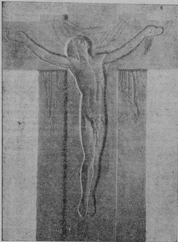
Detalle del monumento funerario que acaba de realizar el escultor Jaime Mir. El artista, con un alarde de técnica y un gran sentido de la estilización de la forma, ha representado a Jesucristo en el momento de su Resurrección a los Cielos. La divina languidez del Resucitado — recién despierto de su sueño terrenal —, encerrada en una línea continuada y vigorosa, coadyuva admirablemente a subrayar la intención espiritualista de este magnífico trabajo, que acredita, una vez más, la autenticidad del arte de Jaime Mir