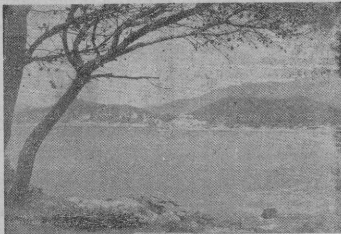
Una cala mallorquina. Desde aquí, en la impunidad de la noche, se hacían a la mar barcas cargadas de incautos...

NI podemos ni queremos decir cuanto hay en este asunto un tanto novelesco pero inmensamente crudo, real, lamentabilísimo. Lo informa, por una parte, la imperdonable desaprensión de esos embaucadores que pintan un mundo de riquezas fáciles más allá de la frontera española que es en el caso nuestro la costa africana, próxima, segura, libre... y por otra la ingenuidad de los que, deslumbrados por esta palabrería pagan a costa de enormes sacrificios, se aprestan a las calamidades de un viaje en embarcaciones cualquiera, y una vez en Argel, indocumentados, huérfanos de toda protección y toda ayuda, comienzan un calvario de cárceles, trabajos brutales en minas, miseria, hambre... Un calvario que no ha de terminar hasta que, otra vez España, Mallorca, abre los brazos de su litoral y sus bahías.