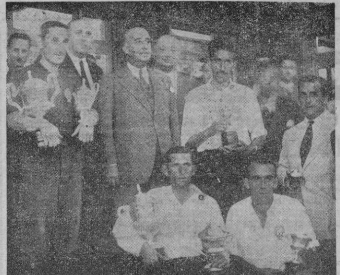
Coruña. — S. E. el Jefe del Estado con los patrones de las traineras que resultaron vencedores en las regatas celebradas el pasado domingo momentos después de haberles hecho entrega de los trofeos correspondientes.