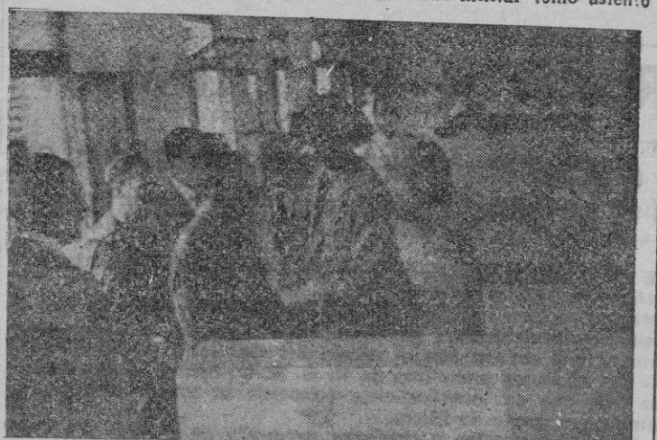
Nuestras primeras autoridades visitan las dependencias del Instituto.

Acto seguido las autoridades e invitados pasaron al Salón de actos donde presidia un retrato de S. E. el Generalísimo Franco. A la derecha de nuestra primera autoridad militar tomó asiento