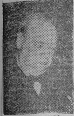
CHURCHILL puede provocar elecciones generales

Lo fatal llega siempre al tiempo justo. La libra está desvalorizada y el área donde verifica sus especulaciones está temblando estos días. Los bancos cierran sus puertas y esperan un día o dos para nivelar los cambios y saber la magnitud de la tragedia. Aunque el hecho no es nada consolador para el mundo del dinero, tiene su matiz sombrío para los que adoran el becerro de oro de Gran Bretaña. Por otra parte Estados Unidos se encoge de hombros, y aunque el ministro de la Guerra británico, Shinwell, haya dicho que algunos de nuestros aliados están íntegramente, olvidando la gran contribución de Inglaterra en la defensa de la democracia, el laborismo va a la deriva, languidece por momento, y no tardará en caer en un canastro de muerte. Porque el laborismo está con relación a su vida gubernamental, en las últimas etapas de su agonía y es de suponer que va a tener un entierro bastante pobre.