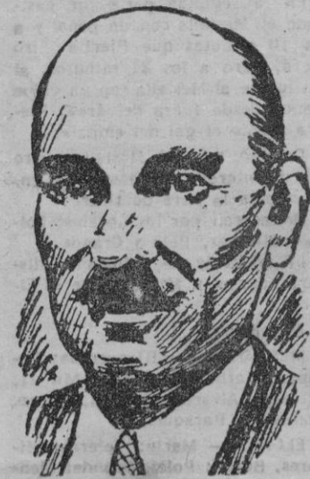
ATTLEE avisa del peligro de que la guerra de Grecia se extienda

Las últimas noticias llegadas de Grecia dan cuenta de las dificultades que ha de vencer su Gobierno para evitar que el Ejército griego avance sobre Albania en persecución de las unidades comunistas recientemente derrotadas que allí se han refugiado. Según parece, no hay soldado del Ejército de Grecia que no arda en deseos de cruzar a tiro limpio la raya fronteriza para liquidar de una vez la constante amenaza roja, ya que desde Albania vuelven los guerrilleros rojos, reorganizadas y rearmadas sus unidades en territorio albanés, tantas veces como son derrotados, a llevar la guerra al suelo de Grecia. Los soldados se están cansando de combatir inútilmente en una guerra con trazas de interminable, porque el enemigo no se acaba en definitiva, y el Estado Mayor, para evitar que después de la última victoria en las montañas de Grammos vuelva a suceder lo de tantas veces, no ve más solución que ocupar militarmente una amplia faja de territorio albanés, e incluso el propio Tsaldaris le ha dicho a Mr. Attlee