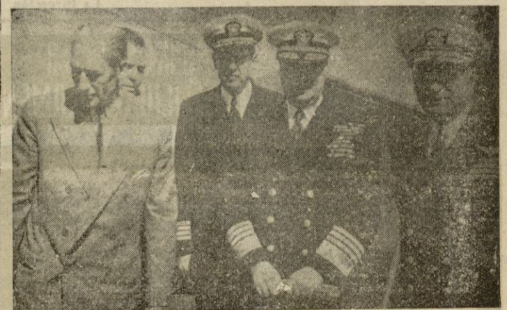
EL ALMIRANTE CONNOLLY EN MADRID

LAS FUERZAS NACIONALISTAS HAN MANIOBRADO PARA CONTENER ESTE ATAQUE, ESTABLECIENDO DOS NUEVAS LINEAS DEFENSIVAS AL NORTE DE ESTA CIUDAD. LAS DEFENSAS DE HENGYANG HABIAN QUEDADO DEBILITADAS AL ENVIAR LOS JEFES NACIONALISTAS HOMBRES DE LA GUARNICION DEL SUR, PARA DEFENDER LA LINEA FERREA DE CANTON CONTRA LOS ATAQUES DE LOS GUERRILLEROS.—(Efe).