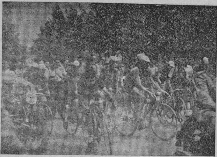
Momento de tomar la salida los corredores participantes en la carrera.

20 corredores tomaron la salida desde el local social del C. C. Mallorca para dirigirse por las Avenidas hacia la carretera de Inca. Alcanzamos el pelotón en el Pont d'Inca, en donde marchan todos en grupo, que capitanea Sas-