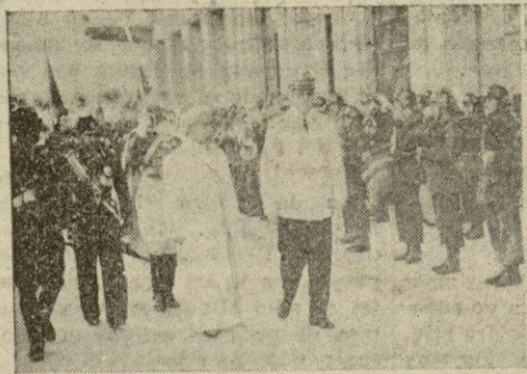
La Coruña.— El Rey de Jordania, acompañado del ministro español de Asuntos Exteriores; y un aspecto del banquete ofrecido al Rey jordano, en el Pazo de Meirás

En el límite de la provincia, la regia comitiva fué recibida por el gobernador civil y el presidente de la Diputación de Toledo, que les