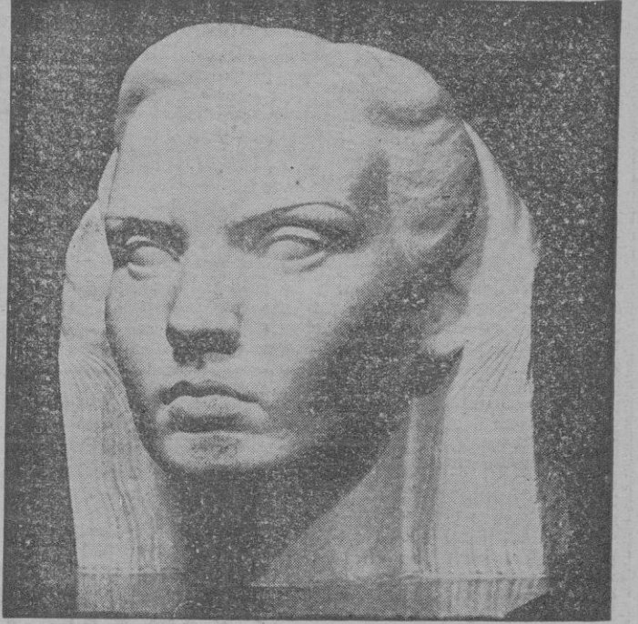
RETRATO, por Horacio de Eguía.

Eguía presenta diversos trabajos que son claros testimonios de un afán por restaurar la belleza formal basada en la pureza de la línea aplomada y firme y al mismo tiempo viva y expresiva. Se observa en toda su obra el mismo deseo de orden y claridad sin noñerías escultóricas que perturben la línea recta de una evolución que, muy sincronizada con el tiempo, viene irremisiblemente aunada a las necesidades vitales de una expresión completamente personal.