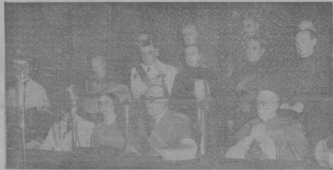
Vich.—El Jefe del Estado durante su trascendental discurso, en la clausura del Centenario de Balines

Inauguró oficialmente la exposición Sir Henri Thomas uno de los más destacados hispanistas británicos. Comprende secciones de arte, historia, literatura clásica y contemporánea, leyes, filosofía, economía política y ciencias. Otra sección está dedicada a los niños y en otras se exponen libros de texto de las escuelas españolas.—(Efe).