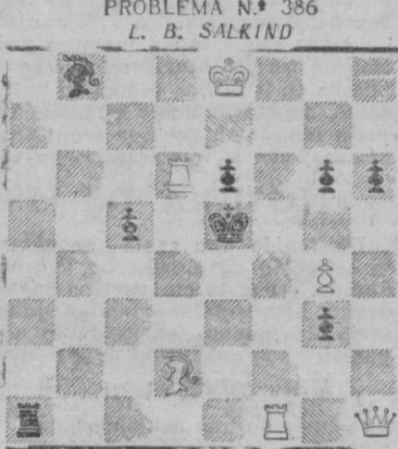
PROBLEMA N.º 385 L. B. SALKIND