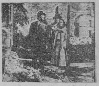
Una escena de la película.

(Sala Astoria Protectora y Metropol) Con la técnica actual del cine americano, del empleo del documental como fondo ambiental, ha sido realizado este film, "Berlin Express". La parte documental nos muestra, en su amarga estampa bélica, varios aspectos de la Alemania destruida por la guerra, escenas de nuestros de Francfort y Berlín, que, entre otras, son las ciudades de la ruta que seguimos en la película.