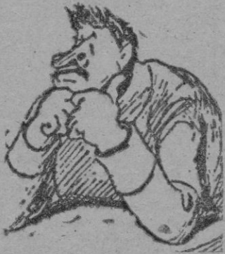
STALIN Amo y señor del más vasto imperio soñado

Y ahora, más que nunca, ante el cariz que toman los acontecimientos militares en China, que amenaza convertirse en un arsenal soviético, y cuyas disponibilidades humanas son inagotables, el cambio político realizado en los Estados Unidos puede resultar beneficioso en el terreno político para la consolidación de esa Unión de la que, sin duda, depende la seguridad y el bienestar de las naciones, pero puede asimismo tomar otro aspecto distinto, en cuyo caso el tiempo se encargará de resolver el jeroglífico mundial, cuya dificultad de resolución pacífica se hace cada día más difícil y complicada, gracias a la presión comunista en los distintos sectores.