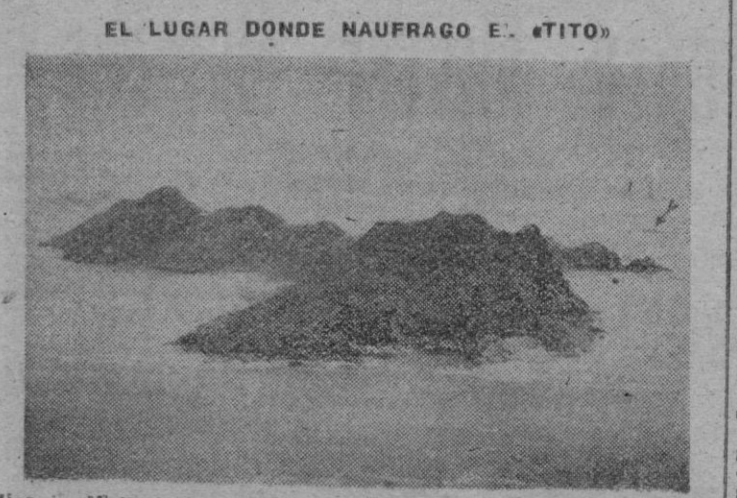
Vigo. — Vista de las Islas Cíes, donde encalló el pesquero «Tito», refugiándose sus tripulantes en la Peña «A Boeira» (marca la flecha), de donde han sido salvados por medio de balsas y cables.

ciado una serie de ataques contra las posiciones holandesas en Java central y meridional. Afirman los republicanos que los holandeses muertos y heridos ascienden ya a seiscientos. Los datos oficiales dan 233 muertos o heridos. La Agencia Aneta dice que los republicanos atacaron dos explotaciones de caucho del oeste de Java, donde causaron considerables daños. Las emisiones inalámbricas afirman que se efectúan considerables actividades de guerrillas y arrasamiento.